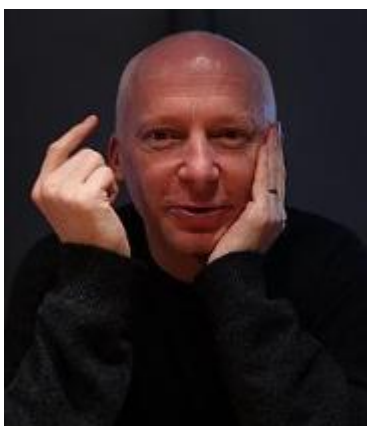
Marcus du Sautoy